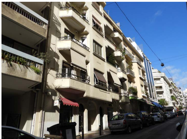
Πολυκατοικίες στην οδό Ηροδότου