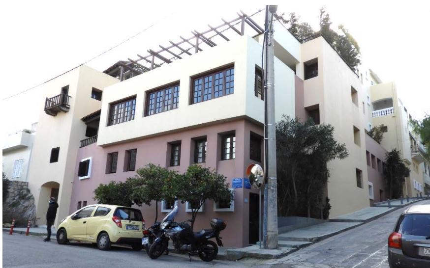
Πολυκατοικία στην οδό Αρχιμήδους 63 και Δόμπολη 17