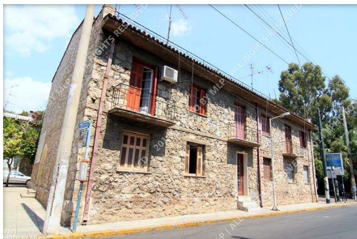
Προσφυγικές κατοικίες στον Αγ.Ιωάννη Ρέντη