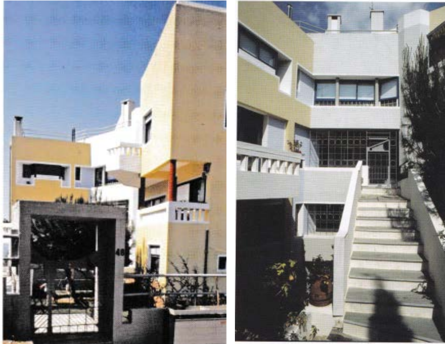
Πολυκατοικία στη Βούλα 1981