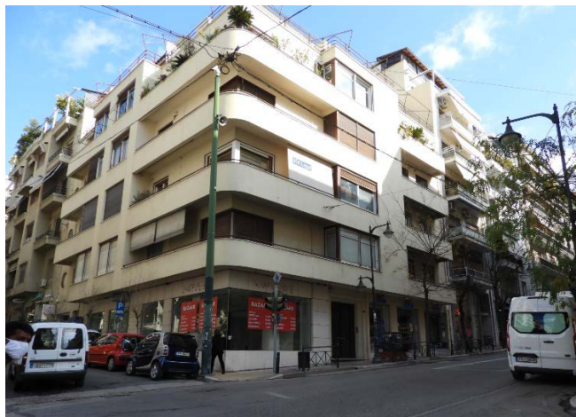
Πολυκατοικία στις οδούς Ηρόδοτου και Πατριάρχου Ιωακείμ