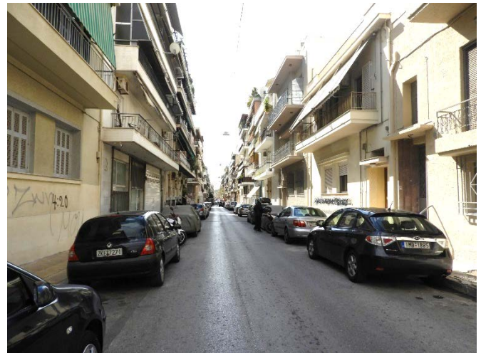
Πέριξ του σταθμού των Πατησίων και των γραμμών του τραίνου