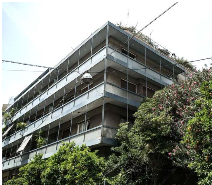
Πολυκατοικία στις οδούς Δεινοκράτους και Λουκιανού