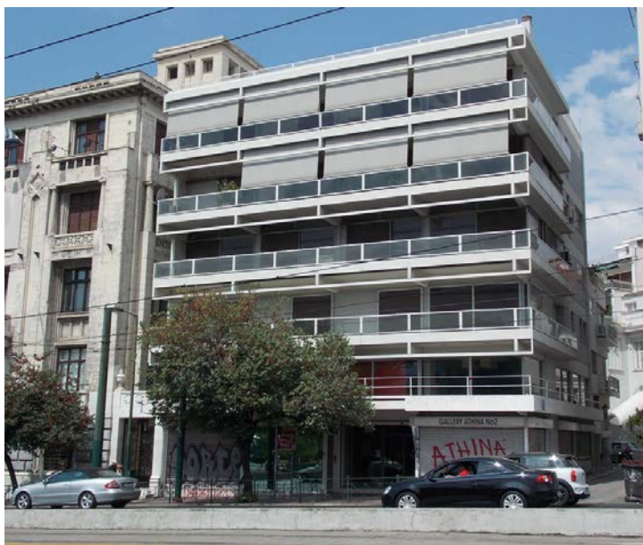
Πολυκατοικία στη Λ.Αμαλίας 34

Ο Τάκης Ζενέτος στις πολυκατοικίες στη λεωφόρο Αμαλίας 34, 1958, και Ηρώδου Αττικού 17, 1959-1960, με μινιμαλιστική αισθητική και ελεύθερη κάτοψη, συμπυκνώνει όλη την αρχιτεκτονική ουσία σε ελάχιστα εκφραστικά μέσα.