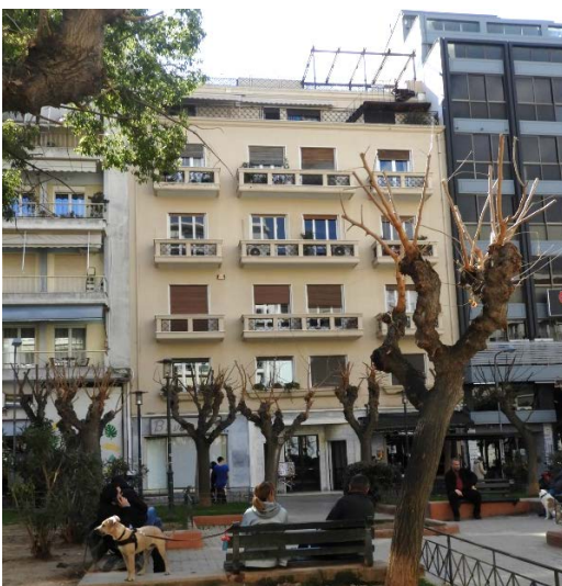
Πολυκατοικία στη Φωκίωνος Νέγρη