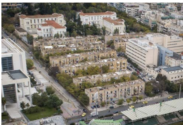
Προσφυγικές κατοικίες στη Λ.Αλεξάνδρας