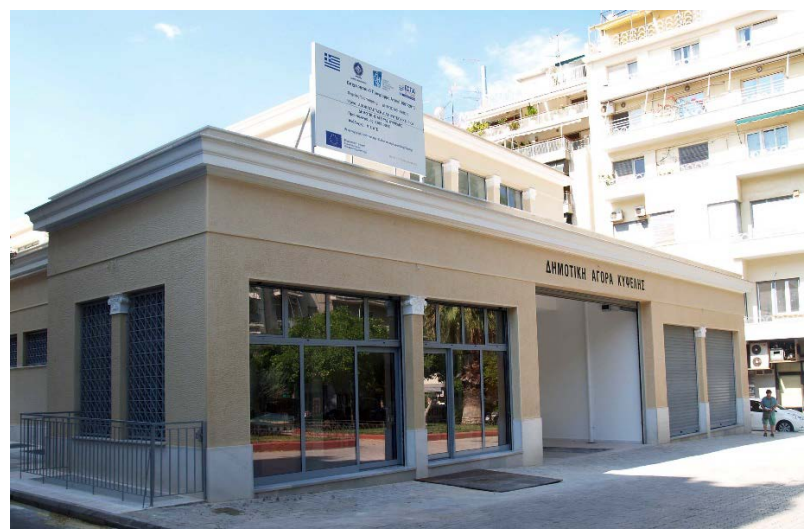
Δημοτική Αγορά Κυψέλης