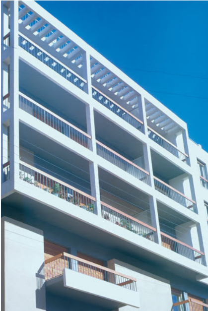
Πολυκατοικία στις οδούς Μαρασλή και Δεινοκράτους

Ο Κωνσταντίνος Δεκαβάλλας, διακεκριμένος αρχιτέκτων του μεταπολεμικού μοντερνισμού, μετά από μια εξαιρετικά δημιουργική εμπειρία στην ανοικοδόμηση της Σαντορίνης όπου ο μοντερνισμός συναντά τον κριτικό τοπικισμό, σχεδιάζει στην Αθήνα σειρά πολυκατοικιών. Μεταξύ αυτών η πολυκατοικία Μαρασλή και Δεινοκράτους, 1960 και Λουκιανού και Δεινοκράτους, 1959-1961, σε συνεργασία με τον Θαλή Αργυρόπουλο, με ιδιαίτερη επεξεργασία των υπαίθριων χώρων.