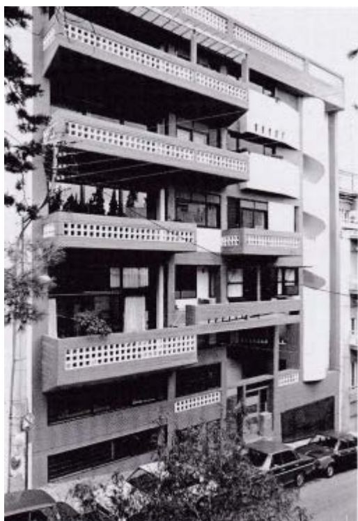
Πολυκατοικία στην οδό Εμ.Μπενάκη

Χαρακτηριστικό παράδειγμα είναι ένα από τα πρώτα έργα τους: η πολυκατοικία στην οδό Μπενάκη, το 1973