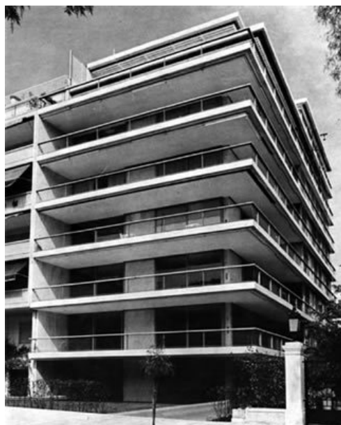
Πολυκατοικία στην Ηρώδου Αττικού 17