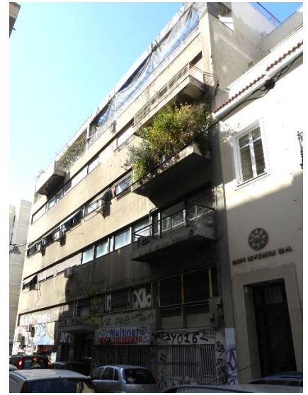
Πολυκατοικία Στουρνάρη και Ζαΐμη, αρχιτέκτων Θουκιδίδης Βαλεντής