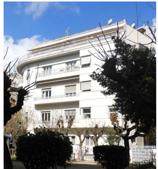
Πολυκατοικία στη Φωκίωνος Νέγρη