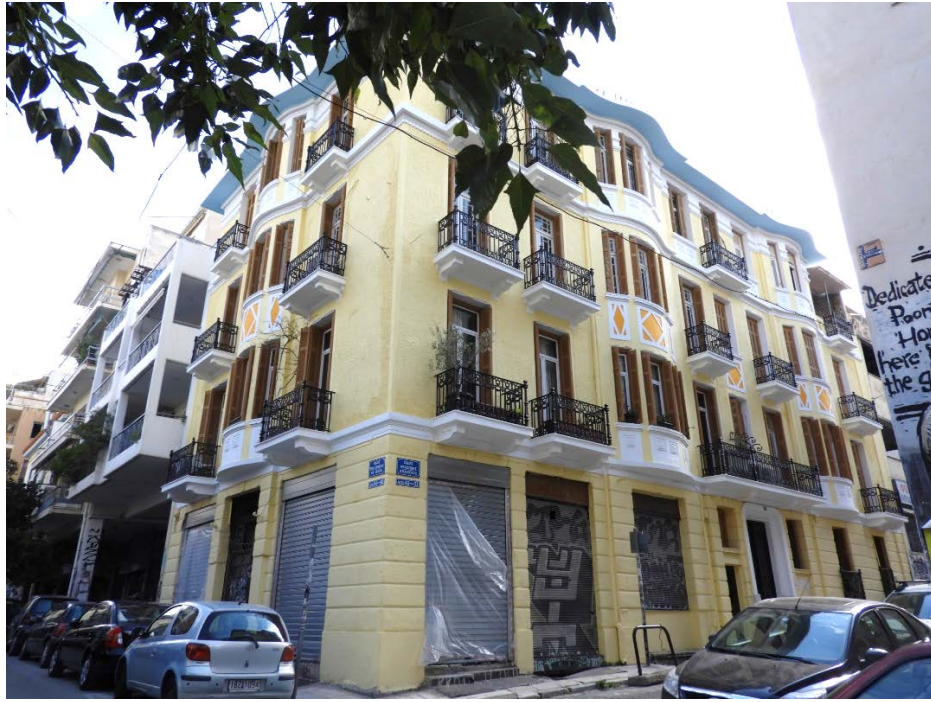
Πολυκατοικία στη συμβολή Εμμ.Μπενάκη και Αραχώβης