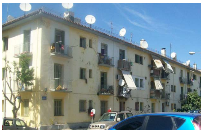
Προσφυγικές κατοικίες στο Δουργούτι