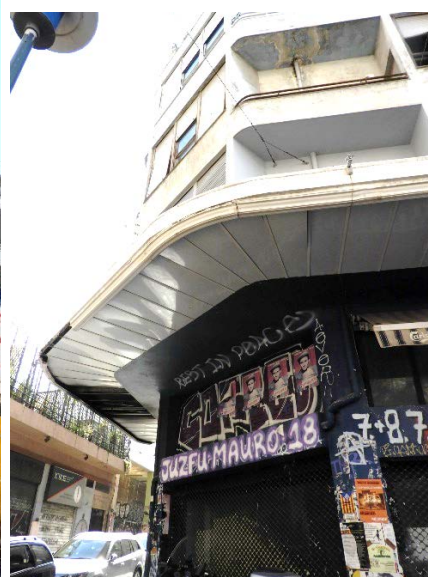
Μπλέ πολυκατοικία Αραχώβης 61 και Θεμιστοκλέους 80, αρχιτέκτων Κυριάκος Παναγιωτάκος