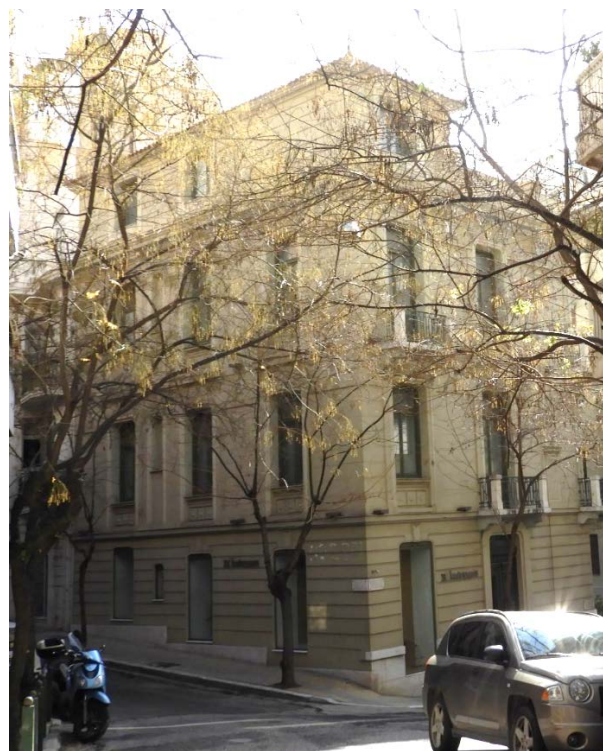
Πολυκατοικία στη συμβολή Ηροδότου και Σπευσίππου