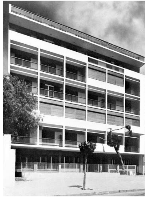
Πολυκατοικία στην οδό Βας.Σοφίας 129